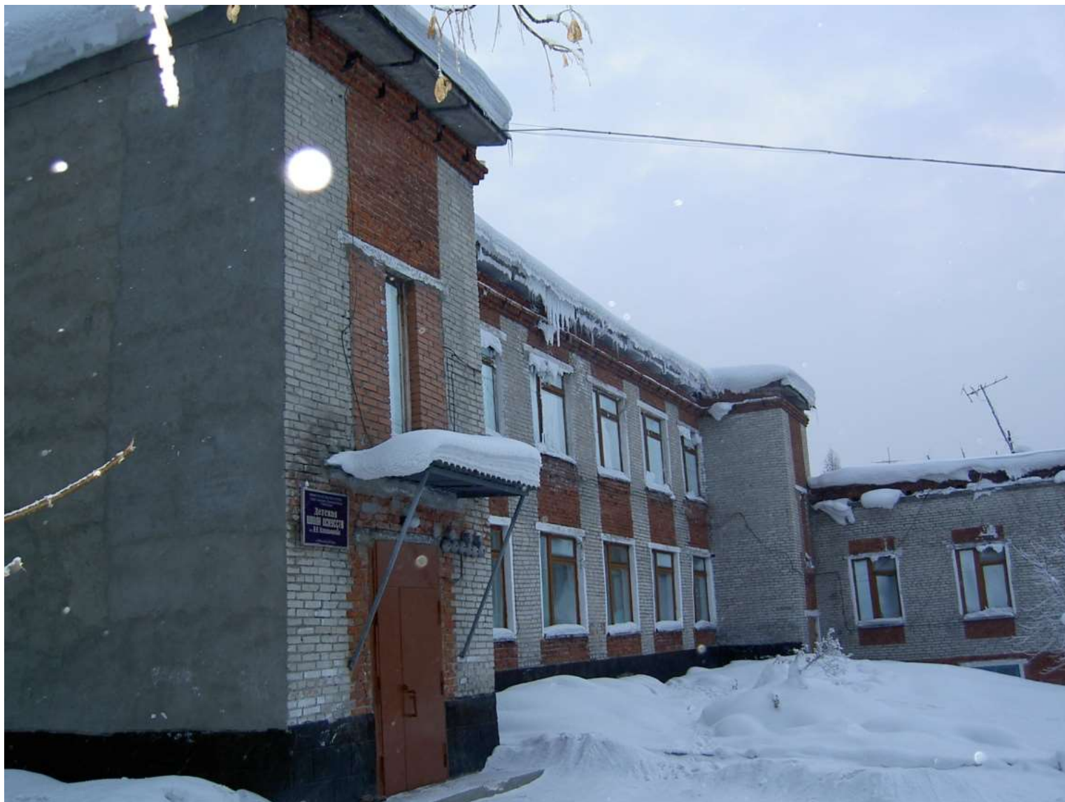
Детская школа искусств имени Н.А.Капишникова