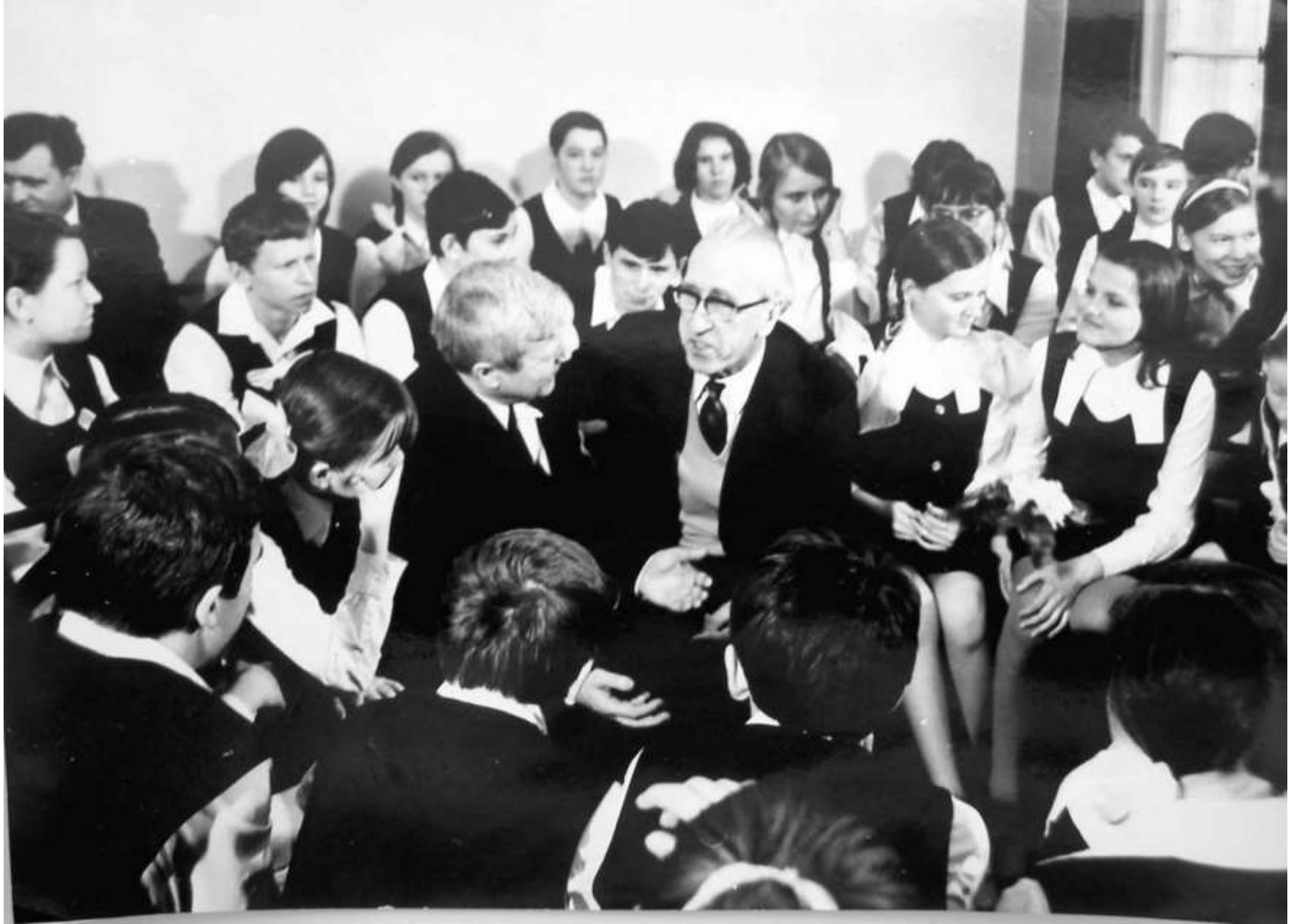
Встреча с Д. Б. Кабалевским. Ленинград. 1974 г.