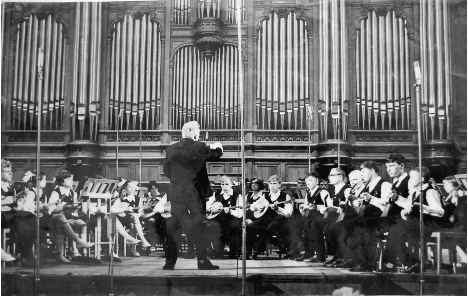
1970 год. Москва. На Международной конференции по эстетическому воспитанию