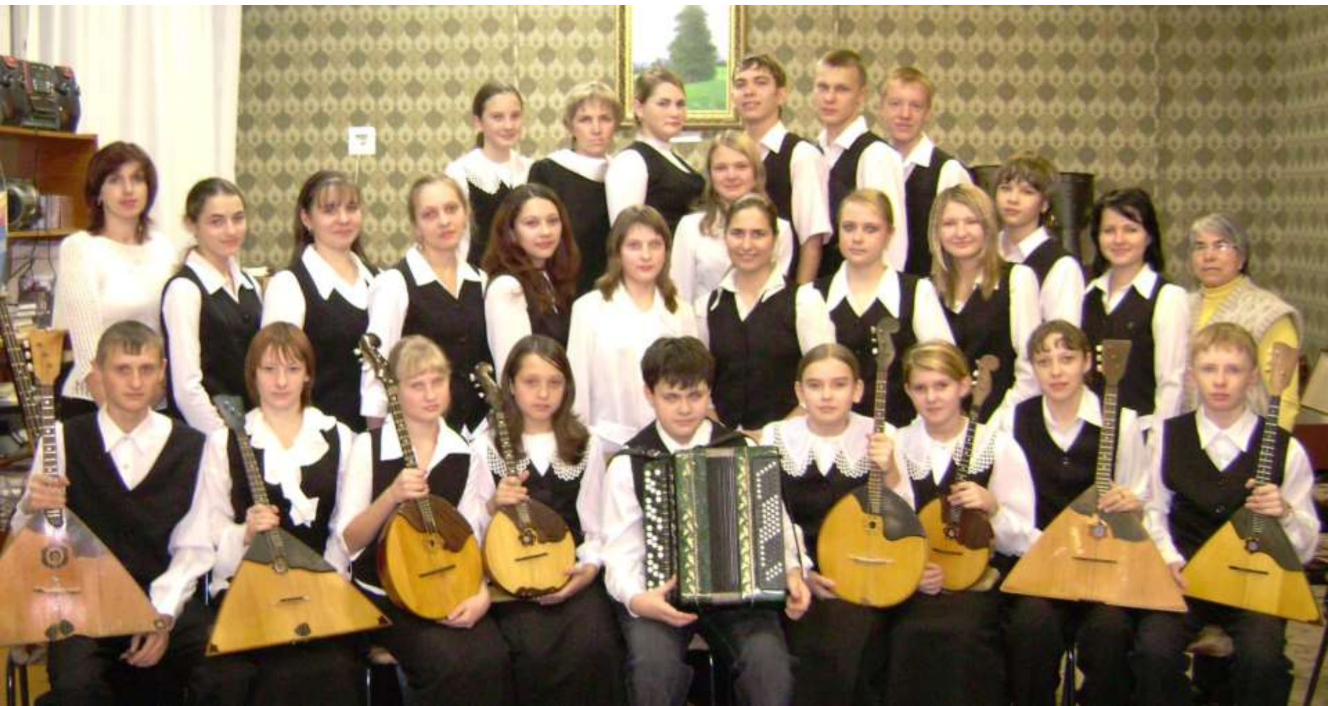
Оркестр русских народных инструментов имени Н. А. Капишникова