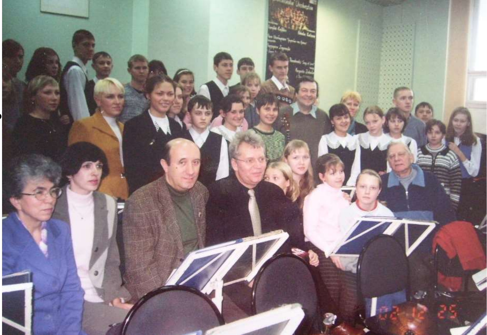
2002 г. Москва. Оркестранты в гостях у Национального Академического оркестра народных инструментов России им. Н.П.Осипова.