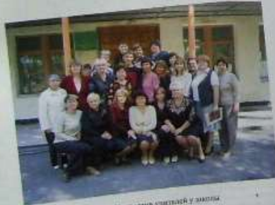
Коллектив учителей и школы Амур, 2007г.