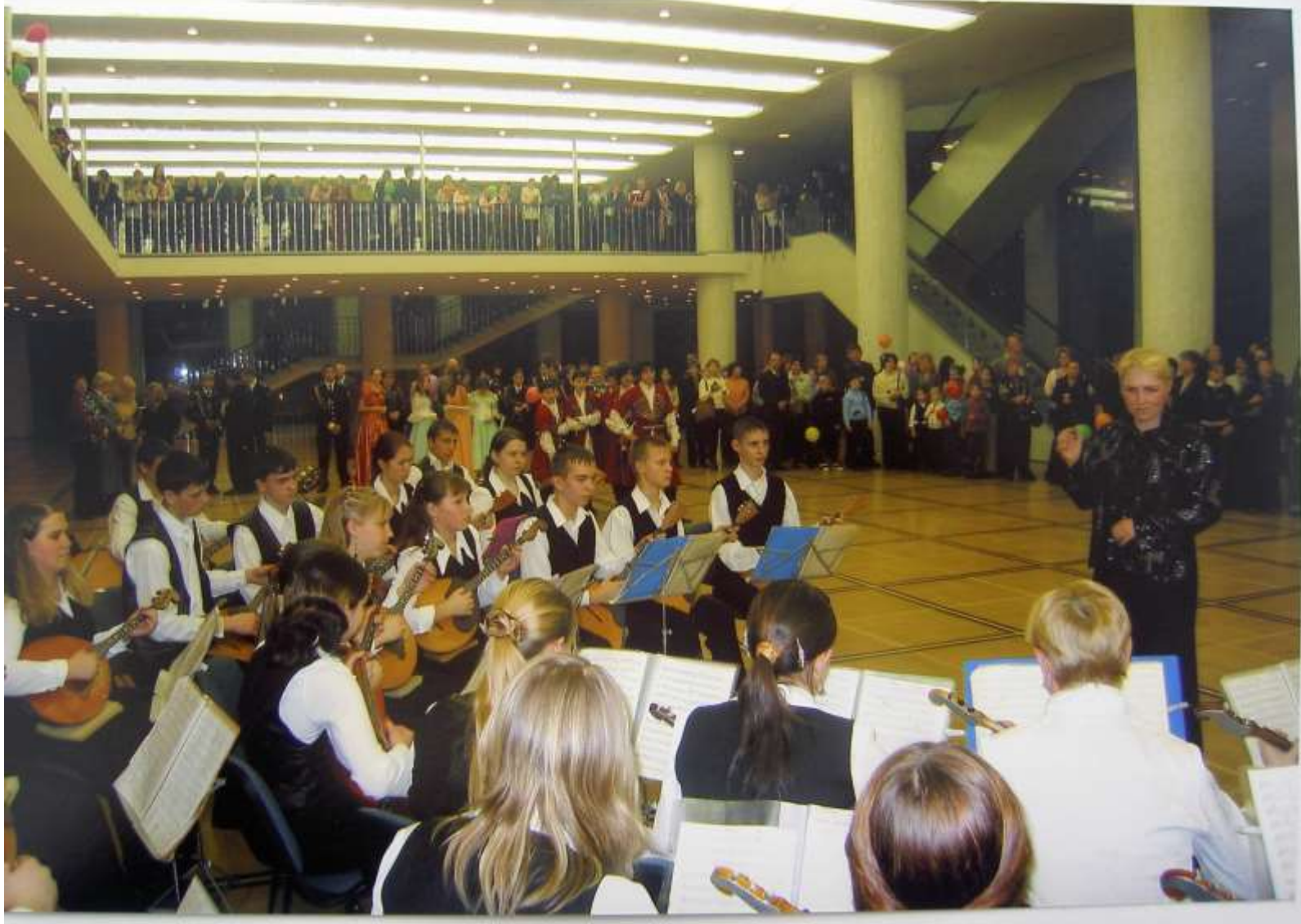
2006 год. Москва. Государственный Кремлёвский дворец