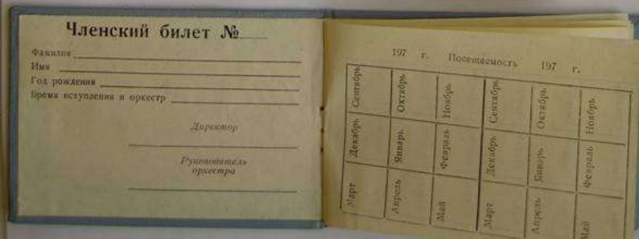
Членские билеты оркестрантов разных лет