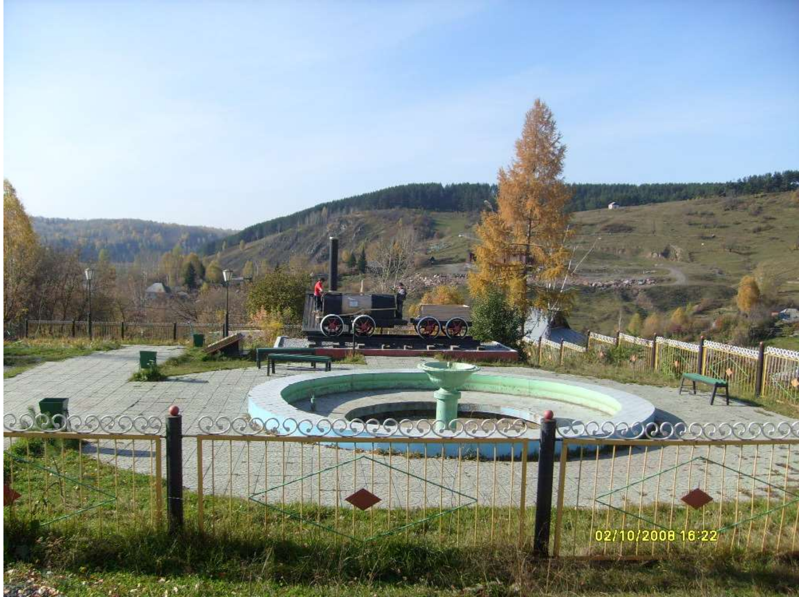
Детская площадка с фонтаном