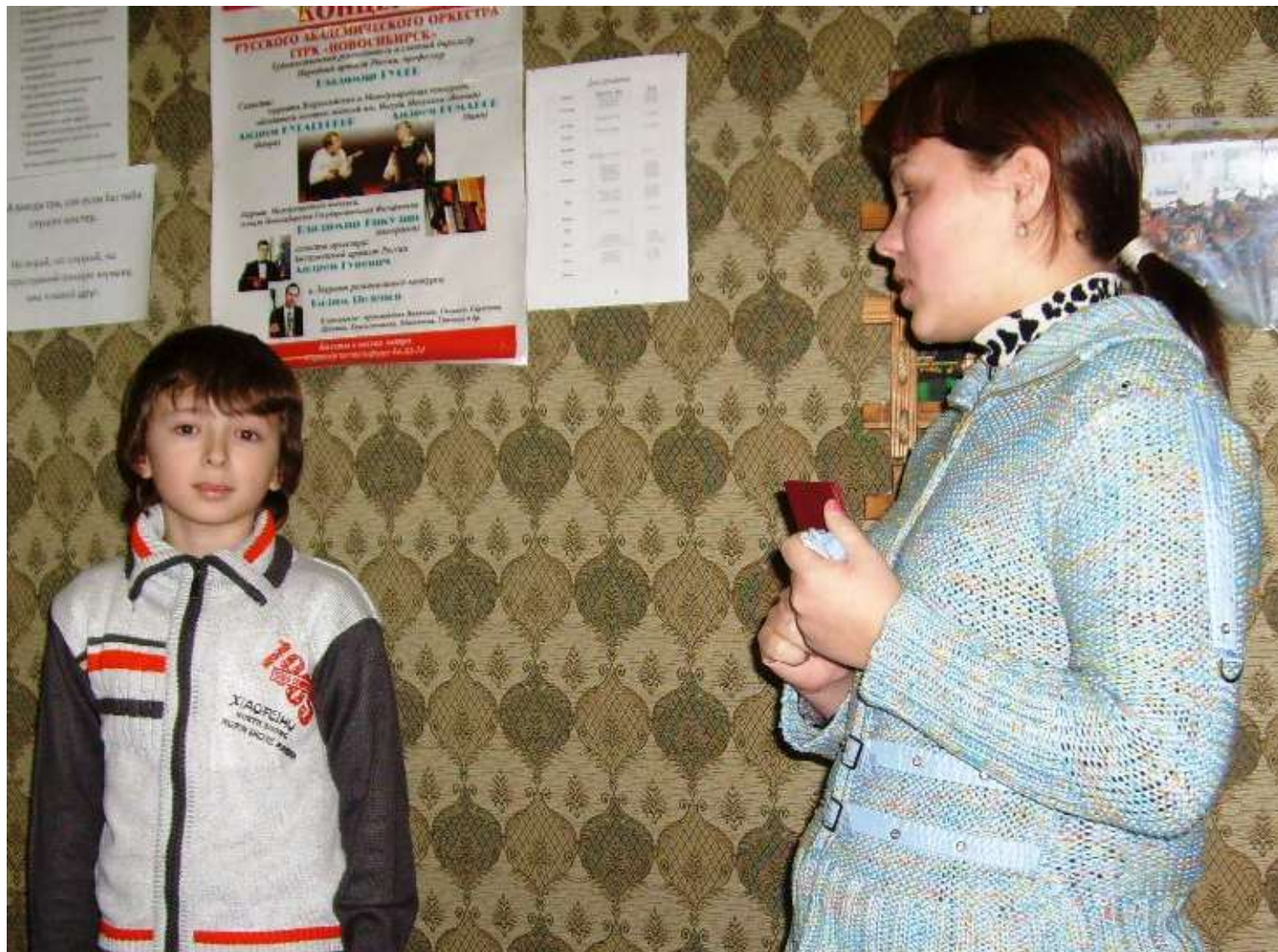
Выпускница оркестра Н. Пчеловодова вручает членский билет новичку. 2011 г.