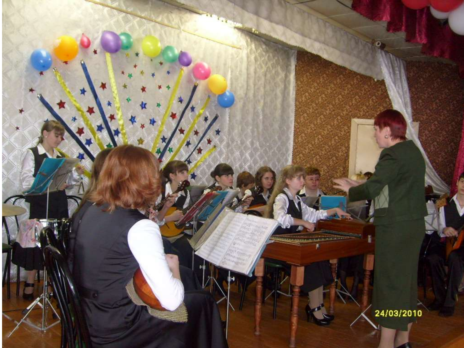
2010г. Малиновка. В школе имени Н.Н.Колокольцова