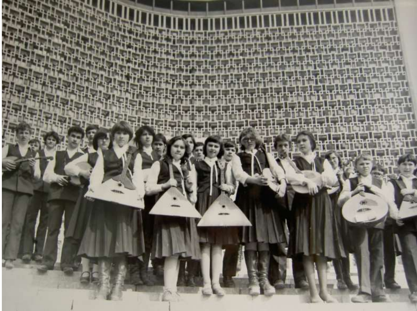
1982 год. Ташкент. На Всесоюзной неделе музыки