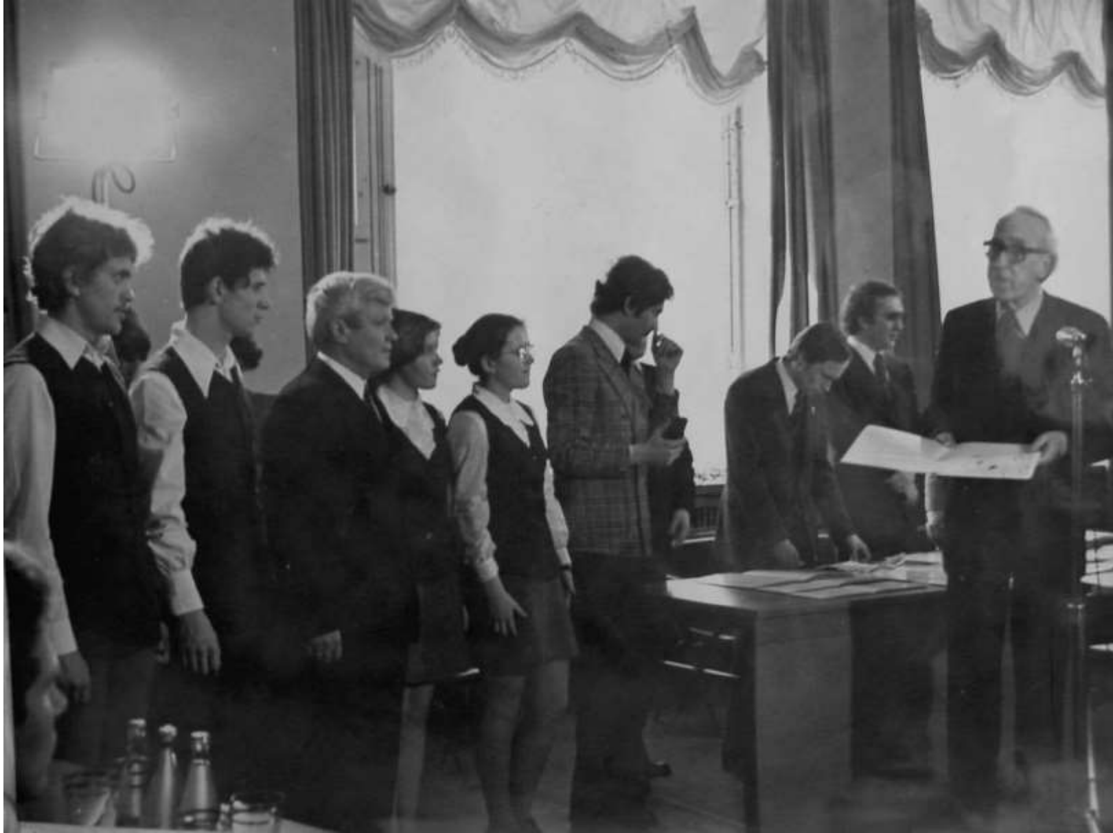
1978 год. Москва. Вручение премии Ленинского комсомола