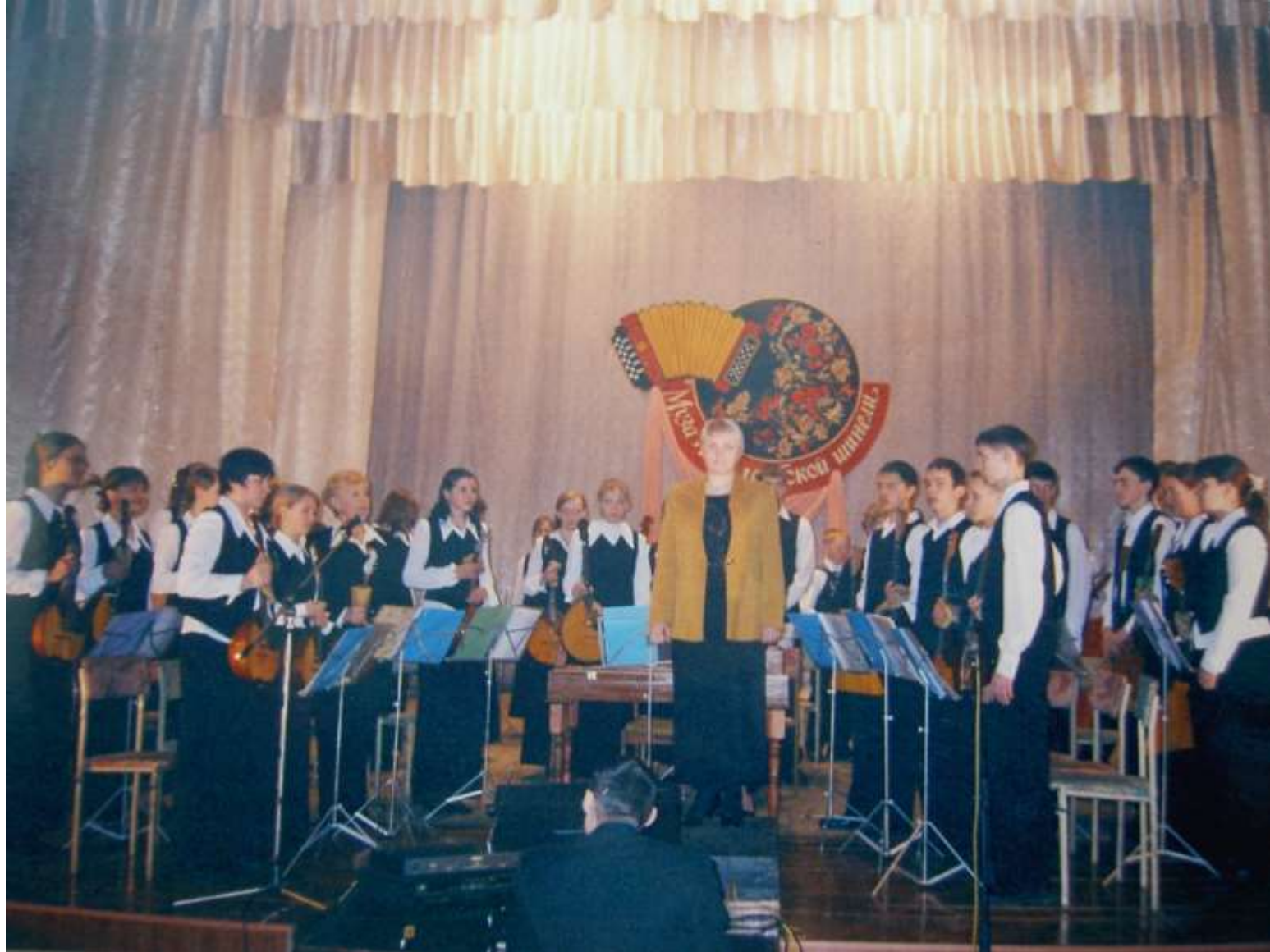
2005 г. Новокузнецк. На конкурсе «Муза в солдатской шинели»