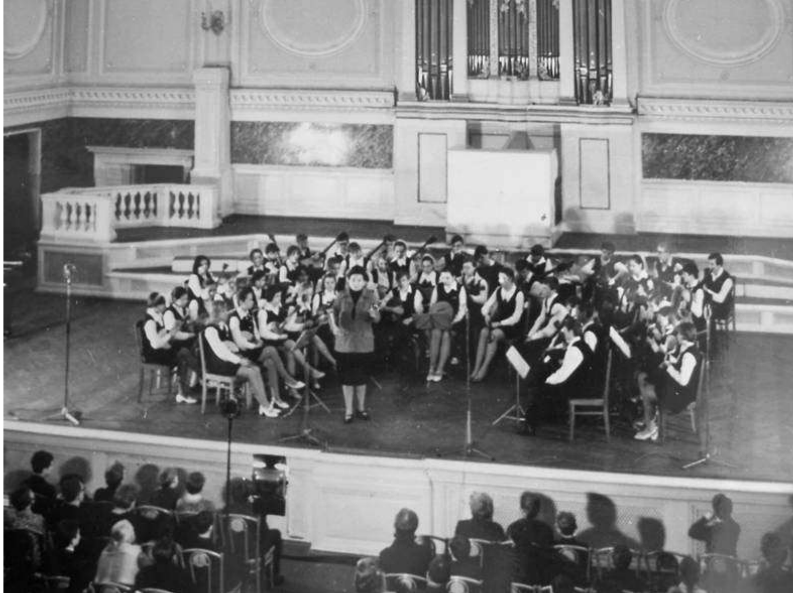
1974 год. Ленинград. В капелле им. М.Глинки