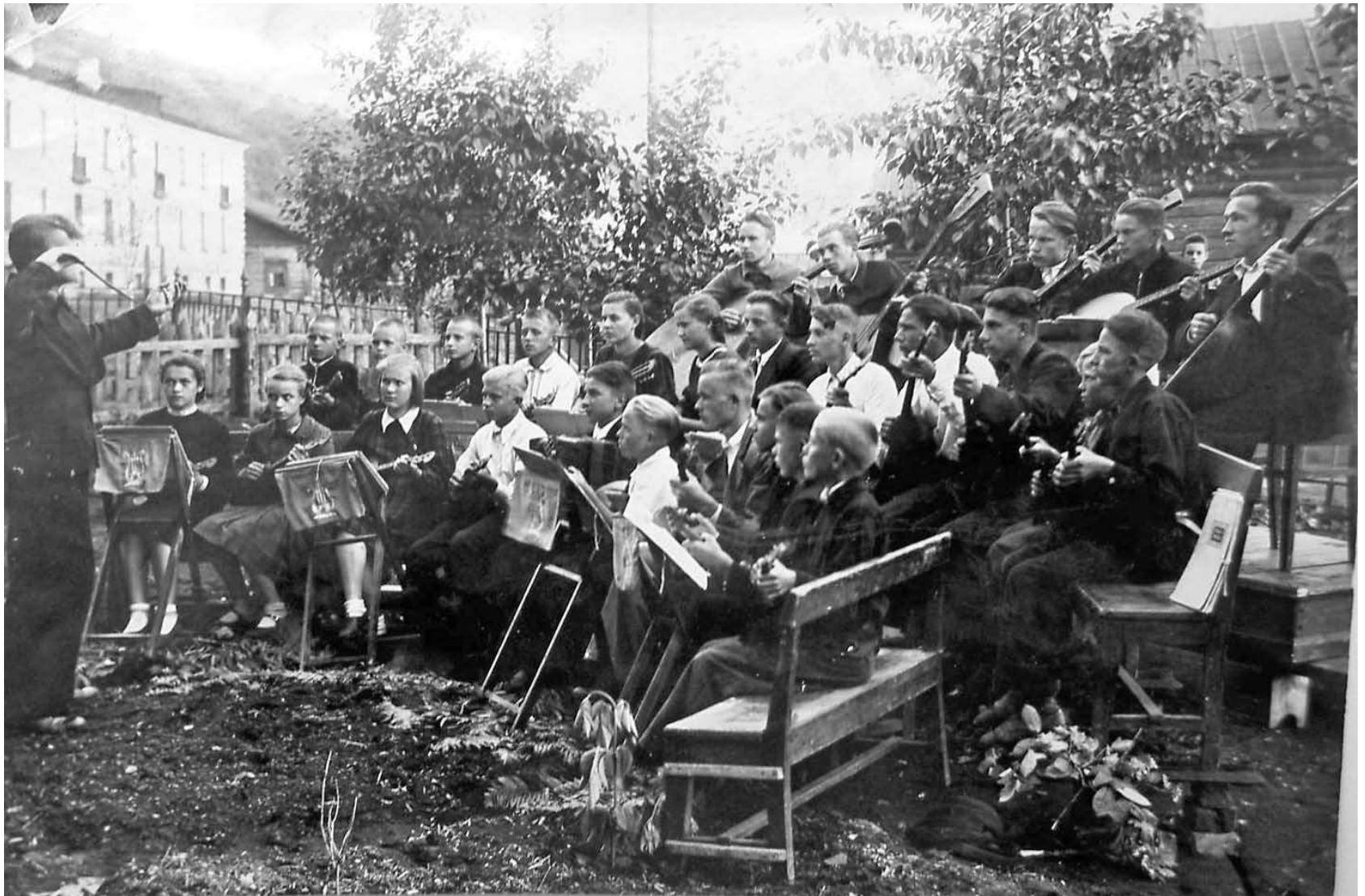
Так начинался оркестр. 1947 г.