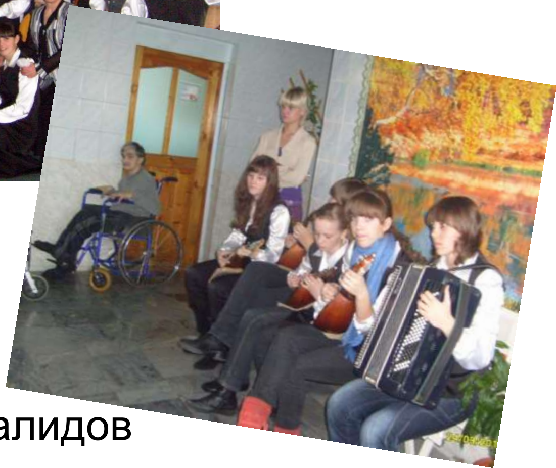
2010 г. В доме инвалидов п. Малиновка