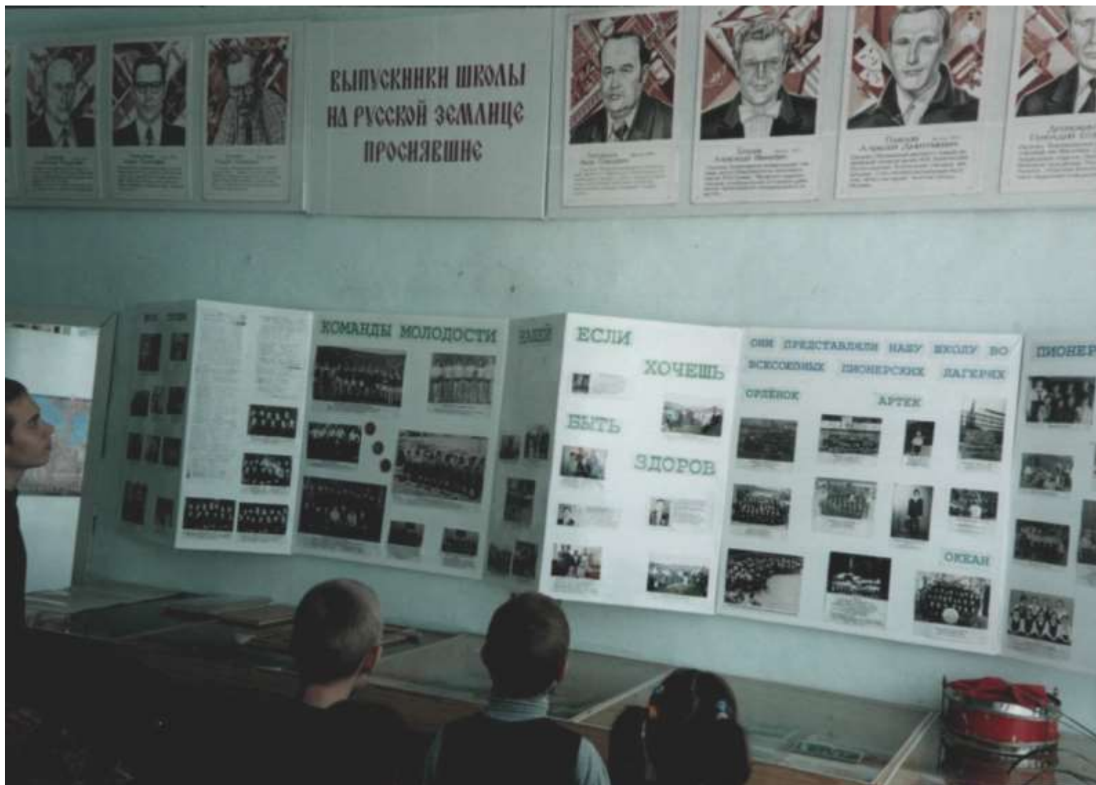
Ученики знакомятся с историей школы